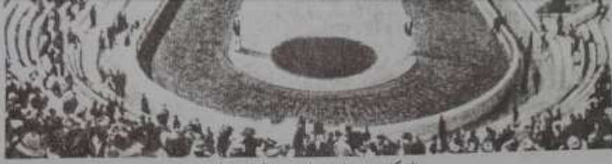
الشكل (١٨) استاد الرخامي الأولمبي في أثينا

أثناء حفل افتتاح أول دورة أولمبية في العصر الحديث عام ١٨٩٦ باليونان.