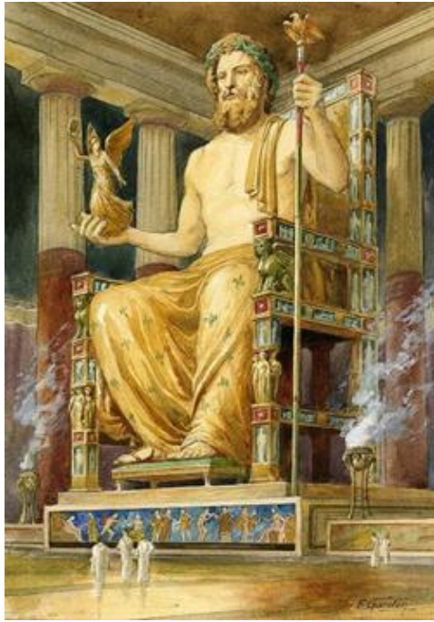
زيوس بيد فيدياس