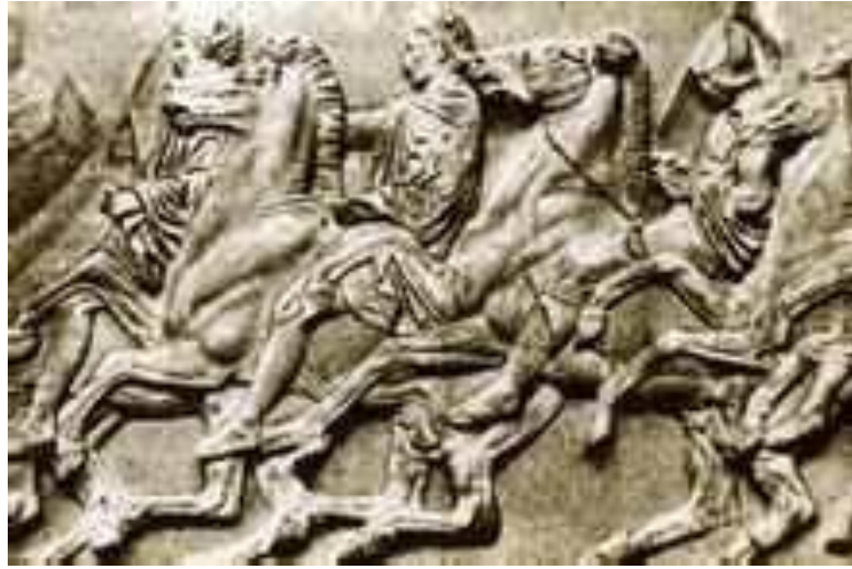
من منحوتات البارثينون من اعمال فيدياس