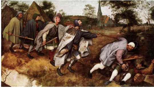
الصورة رقم 5: بيتر بروغل - "المكفوفون" 1568

ولد بروغل القديم في قرية قرب بريدا أطلق عليها فيما بعد اسمه، ومات في بروكسل، ودرس في (غابة الدوق) متأثراً