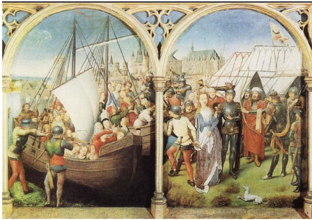
الصورة رقم 3: هانز مملنك - قصة القديسة أورسولا

ويأتي بعد الأخوين فان إيك، المصور مملنك الذي حقق شهرة مماثلة حيث عاش في بروغ خاصة بعد أن زين مستشفى سان جان برسومه. وقد تناول مملنك المواضيع الدينية، ومن أشهر رسومه مجموعة قصة القديسة أورسولا الموجودة في مستشفى سان جان في مدينة بروغ (الشكل 3). ومن صور