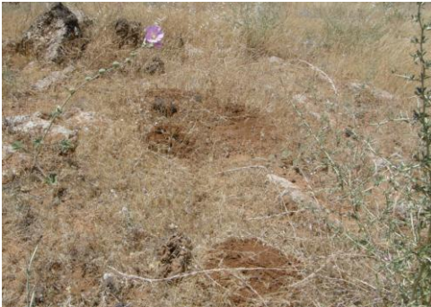
الشكل (11) أكوام Nannospalax ehrenbergi