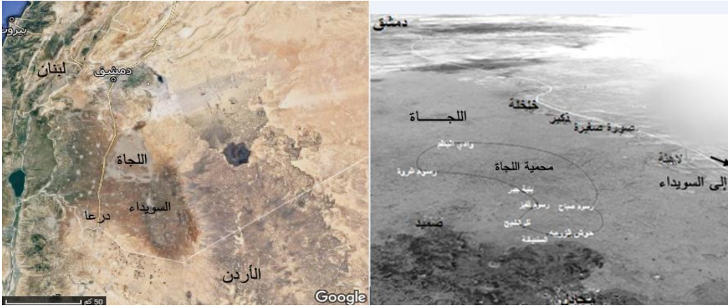
الشكل (1) خريطة تظهر منطقة اللجاة في جنوب سورية، وموقع المحمية فيها