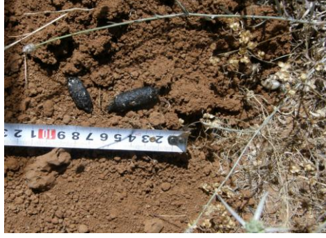
الشكل (4) براز Vulpes vulpes