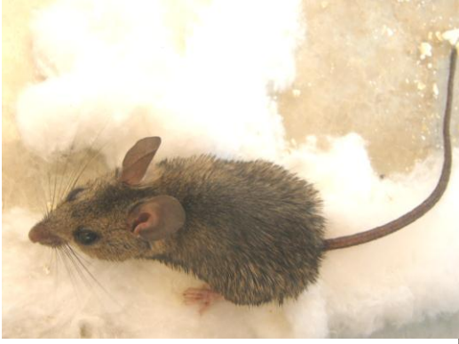
الشكل (7) Apodemus mystacinus