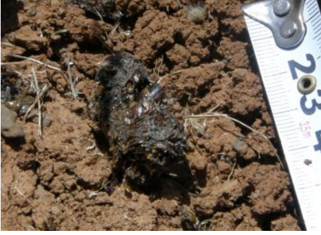
الشكل (5) براز الغرير Meles canescens

شوهدت الأكوام الترابية المميزة للخلد في كثير من أرجاء المحمية (الشكل 11)، وبخاصة في المناطق قليلة الوعورة، ذات الترب الرخوة. وهو واسع الانتشار في جنوبي سورية (الحسين، 1985)، وكذلك في المناطق الغربية وبخاصة في هضبة الجولان، والبيانات حول انتشاره في المناطق الداخلية قليلة؛ فهو مسجل فقط في تل أبيض وعين العروس (Misonne, 1957)، كما سجل في قلعة الحصن من خلال لقيات اليوم (Nadachowski et al., 1990)، وأشار Harrison & Bates (1991) أنَّ الأكوام الترابية التي شاهدها بجوار تدمر قد تعد الحد الفاصل لانتشاره في عمق البادية.