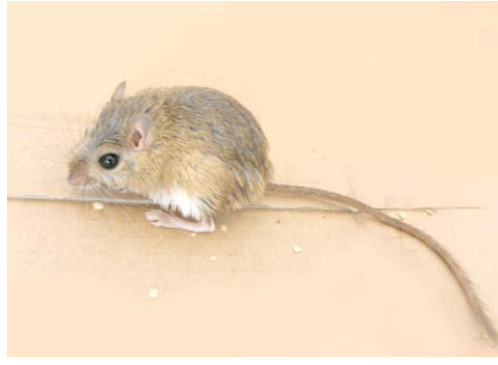
الشكل (8) Gerbillus dasyurus