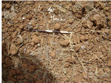
الشكل (10) شوكة من أشواك النيص