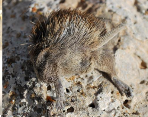
الشكل (6) Acomis russatus