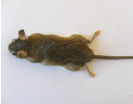
الشكل (9) Meriones tristrami