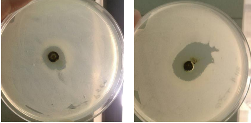
عزلة جراثيم S. aureus

نتائج هذه الدراسة مع نتائج عبد علي وزملائه (2012) إذ سجلت الخلاصة الميثانولية أفضل تأثير في الجراثيم المدروسة، وكذلك ما ذكره Sampathkumar وزملاؤه (2017) بأن الخلاصة الميثانولية لطحلب C. vulgaris كانت الأفضل من حيث التأثير والتي ثبطت نمو جراثيم E. coli بقطر هالة 0.8 cm وهذه الأخيرة التي تعدّ من الجراثيم التي لم تتأثر بخلصات Chlorella المختلفة في العديد من الدراسات.