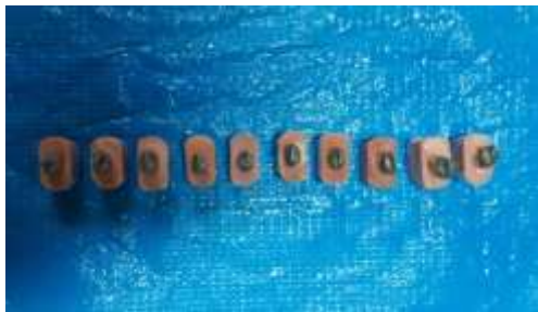
الشكل (1) عينة احدى المجموعات

تم استخدام برنامج SPSS الإصدار 13 وتم تحليل النتائج باستخدام اختبار تحليل ANOVA و BONFERRONI لاختبار وجود أية فروق إحصائية ذات دلالة بين المتوسطات المدروسة في كل المجموعات، وذلك عند مستوى الثقة 95%.