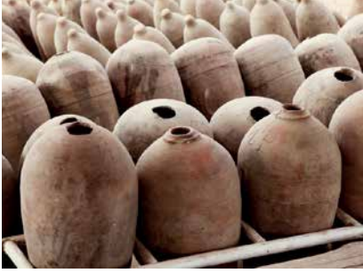
The Power of Forever Photography @

المؤشر الجغرافي إشارة توضع على المنتجات التي لها منشأ جغرافي محدد وصفات أو سمعة تعزى إلى ذلك المنشأ.